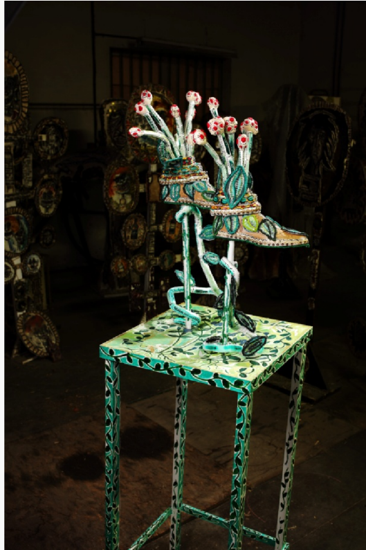
Marcher avec les plantes

"Marcher sur l'eau, danser avec les flammes, traverser les nuages, entre la pantoufle de vair et les bottes de sept lieux , magiques, elles comprennent les végétaux, chaussent les fées , poésie de l'objet qui se décline sorti tout droit des contes ."