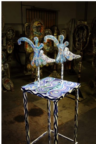
Marcher sur l'eau